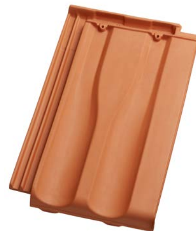
Rozměry základní tašky [mm]