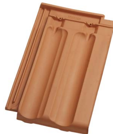
Rozměry základní tašky [mm]