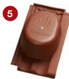
5 komplet pro odvětrání