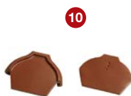
10 ukončení hřebenáče vrchní / spodní č. 2