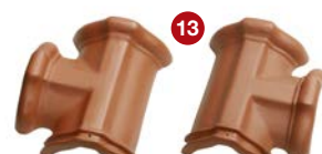
13 rozdělovací hřebenáč T levý / pravý č. 2