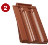
2 taška okrajová levá