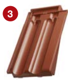
3 taška okrajová pravá