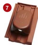
7 solární komplet