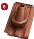
6 anténní komplet