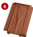
4 taška větrací 15 cm 2