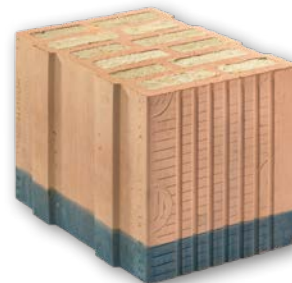
ČSN EN 771-1

Cihly Porotherm 38 TBS Profi jsou dodávány zafóliované na vratných paletách rozměrů 1180 x 1000 mm. - počet cihel 72 ks/pal - hmotnost palety cca 1335 kg Malta pro tenké spáry, lepidlo pro zdění ani základací malta nejsou součástí dodávky.