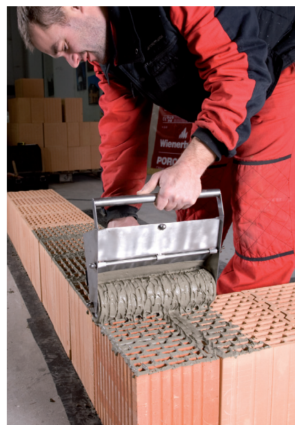
Nanášení válcem na žebra cihel