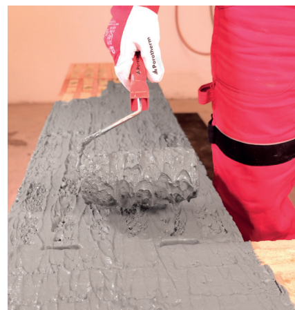
Nanášení celoplošné malty moltoprenovým válečkem Porotherm Easy na celou plochu ložné spáry cihel plněných minerální vatou